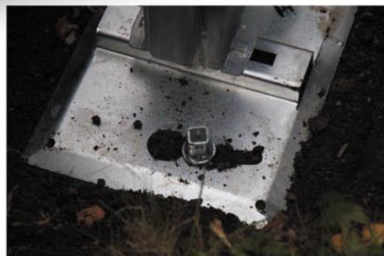
Jordborren som extra säkerhet

* Borrhälskäft krävs för montering av jordbör, säljes separat och är en engångsinvestering